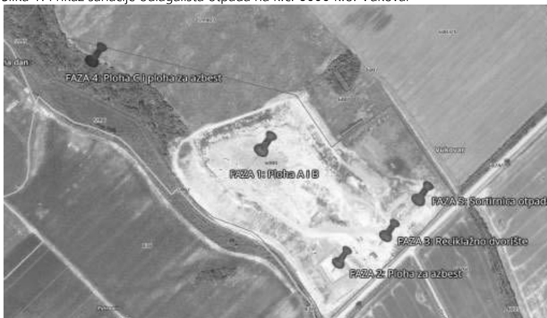
Slika 1: Prikaz sanacije odlagališta otpada na k.č. 6000 k.o. Vukovar

Izvor podataka: PLAN GOSPODARENJA OTPADOM GRADA VUKOVARA 2017. - 2023.