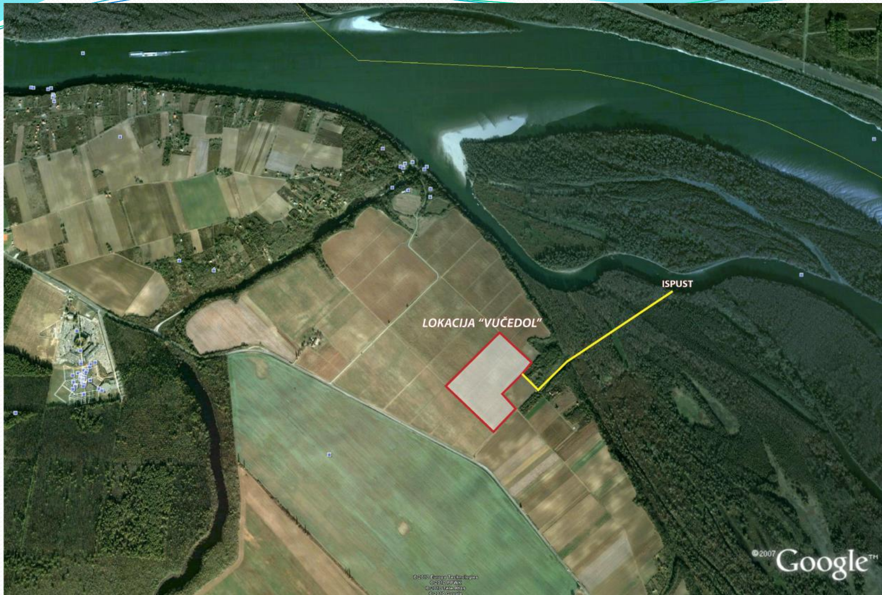
SLIKA 3: Lokacija Vučedol - Haglovi