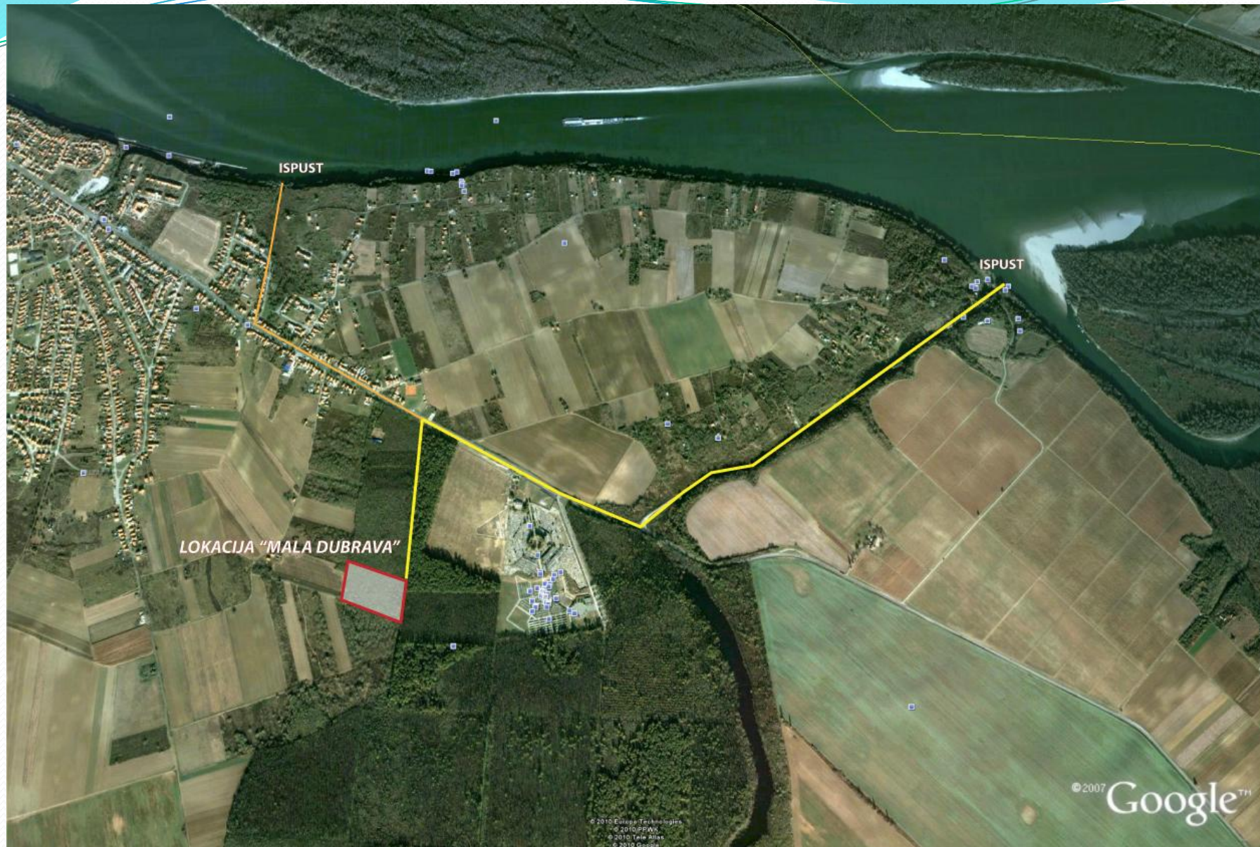
SLIKA 1: Lokacija Mala Dubrava