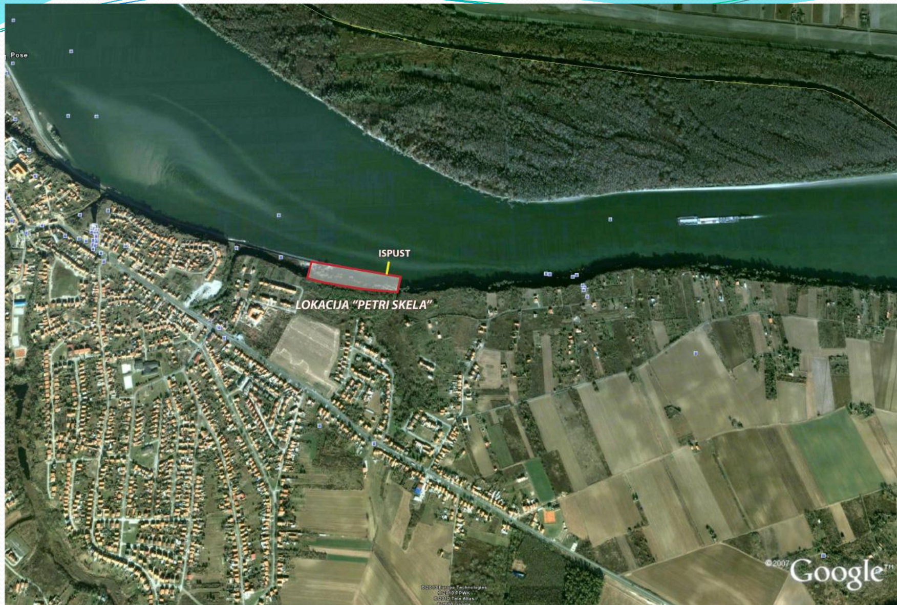
SLIKA 2: Lokacija Petri Skela